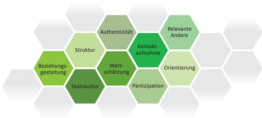
Abbildung 3: Neun Bausteine guter Praxis